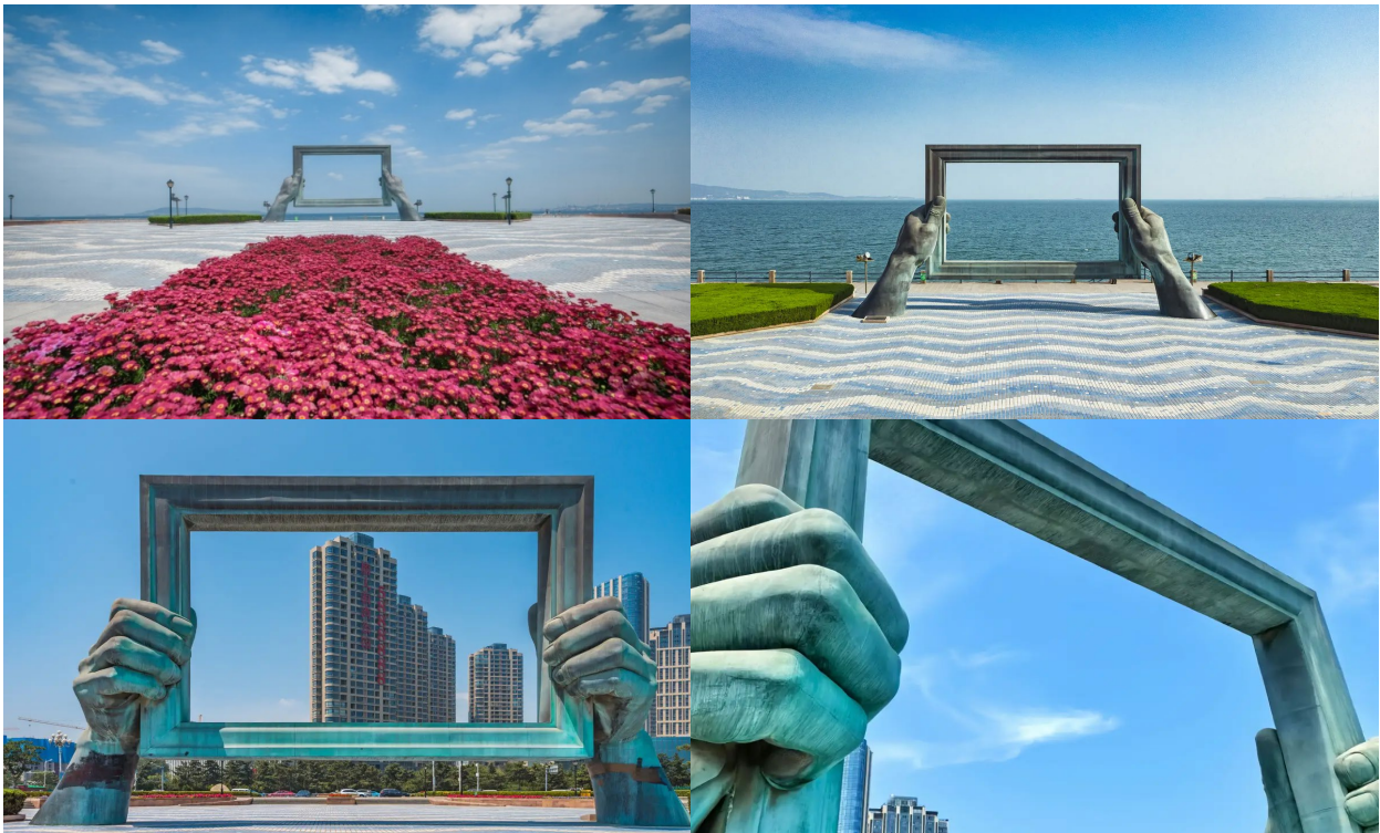
พาชม ถนนคบเพลิงสายที่แปด (Weihai - Torch Eight Street) เป็นย่านวัฒนธรรมเมืองเว่ยไห่ จุดเช็คอินที่ไม่ควรพลาด คือ “The Window of the Sea” กรอบรูปสถาปัตยกรรมขนาดมหึมาที่ตั้งตระง่านอยู่ริมมหาสมุทร ที่มีชีวิตชีวาและสร้างสรรค์ซึ่งรวบรวมศิลปะ แฟชั่น และอาหารอันหลากหลายเข้าไว้ด้วยกัน