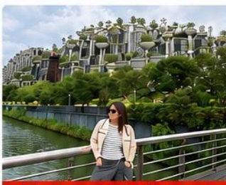
Tian an 1000trees