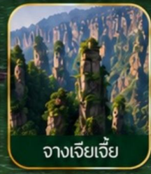
จางเจียเจีย