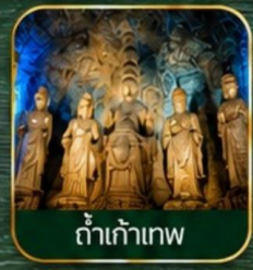
ดำเก้าเทพ