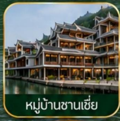
หมู่บ้านซานเซี่ย