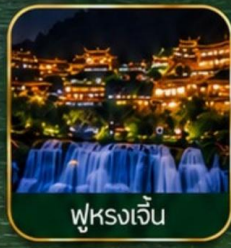
ฟูหรงเจิ้น