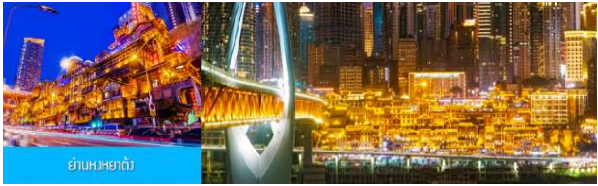
ย่านหงหยาดัง