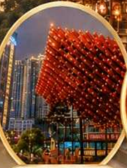
หอศิลป์กัวไถ่ Guotai Arts Center