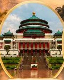
ศาลาประชาชน Great Hall of the People