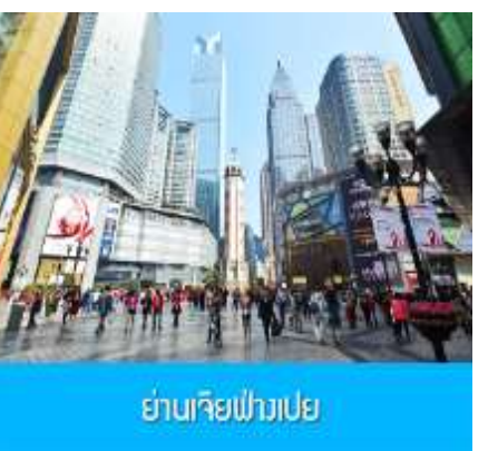
ย่านเจียวฟางเปย