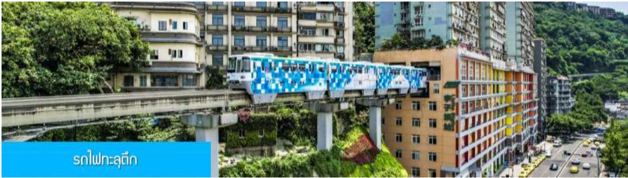
รถไฟฟ้าชุนตง

ถ้า อิสระอาหารมื้อค่ำ เพื่อให้ท่านได้เลือกชิมอาหารพื้นเมืองตามอัชฌาศัย พักที่ HOLIDAY INN EXPRESS HOTEL โรงแรมระดับ 4 ดาวหรือเทียบเท่า เมืองจงชิ่ง