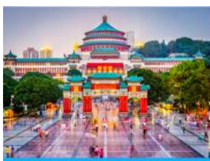
ศาลาประชาคม