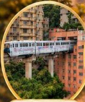
รถไฟทะเลตุ๊ก Liziba Station

◆ สัมผัสเสน่ห์เมืองโบราณและความทันสมัย ◆