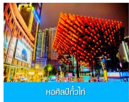
หอศิลป์กั๋วไท่

พักที่ HOLIDAY INN EXPRESS HOTEL โรงแรมระดับ 4 ดาวหรือเทียบเท่า เมืองฉงชิ่ง