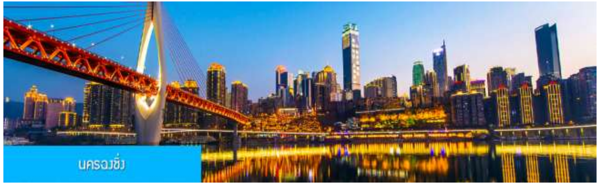
นครฉงชิ่ง