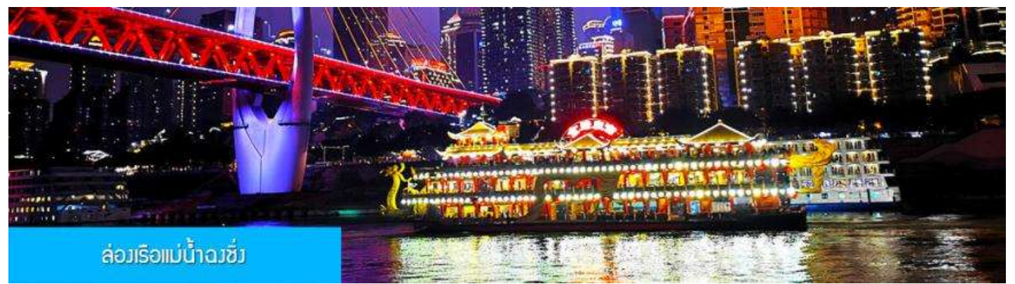
ล่องเรือแม่น้ำฉงชิ่ง