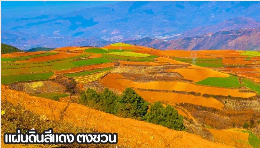
แผ่นดินสีแดง ตงชว่น

นำทุกท่านเดินทางสู่ เมืองตงชว่น (DONGCHUAN) หรือที่รู้จักกันในชื่อ หงถู่ตี้ ซึ่งแปลว่าแผ่นดินสีแดง เมืองตงชว่นตั้งอยู่ทางทิศตะวันออกเฉียงเหนือของมณฑลยูนหนาน มีภูมิประเทศเป็นทิวเขาสลับซับซ้อน ชาวพื้นเมืองส่วนใหญ่ประกอบอาชีพปลูกข้าวสาลี มันสำปะหลัง ผักต่างๆ และดอกไม้มานานาพันธุ์ และตงชว่น ยังถือว่าเป็นจุดท่องเที่ยวไฮไลท์อีกหนึ่งแห่งของคุณหมิง เป็นจุดที่นักท่องเที่ยวนิยมแวะมาเก็บภาพบรรยากาศที่สวยงาม นำท่านชม ภูเขาเจ็ดสีแห่งตงชว่น หรือ แผ่นดินสีแดง (DONGCHUAN RED LAND) ตั้งอยู่ในเขตเมืองตงชว่น ทางตอนเหนือของคุณหมิง มีภูมิประเทศเป็นทิวเขาสลับซับซ้อนและ