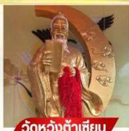
วัดห้วงต้าเซียน