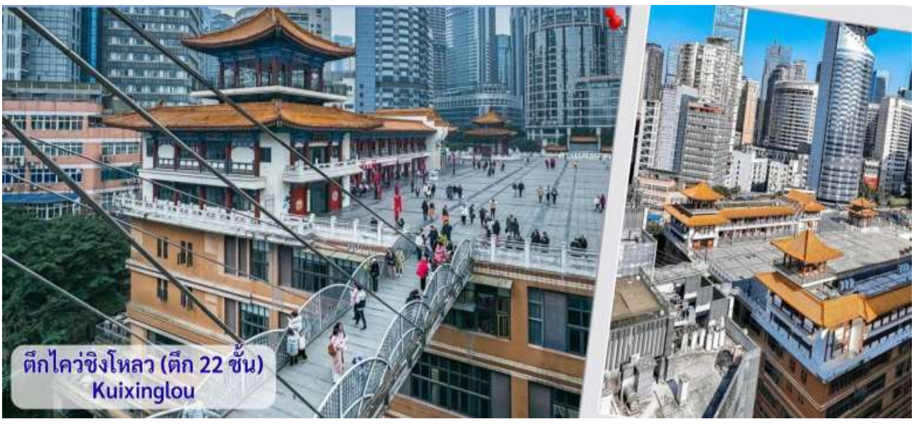
ตึกไควซิงโหลว (ตึก 22 ชั้น) Kuixinglou

จากนั้นอิสระถ่ายรูปหน้าตึกตะเกียบ ฉงชิ่ง(ด้านนอก) คือ ฉงชิ่งกั๋วไทอาร์ตเซ็นเตอร์ (Chongqing Guotai Arts Center) เป็นแลนด์มาร์กสำคัญที่มีสถาปัตยกรรมคล้ายตะเกียบยักษ์สีแดงและดำวางซ้อนกัน เป็นศูนย์จัดแสดงงานศิลปะและสถานที่ท่องเที่ยวที่นิยมสำหรับการถ่ายรูป โดยเฉพาะในเวลาากลางคืนเมื่อเปิดไฟสวยงาม สิ่งก่อสร้างอันมีเอกลักษณ์ อาคารนี้ถูกวางโครงสร้างให้มีรูปร่างคล้ายกอง "ตะเกียบยักษ์" สีดำและแดงที่วางซ้อนกันเป็นชั้นๆ ที่ส่วนปลายของตะเกียบสีแดงจะมีตัวอักษรจีนคำว่า "กั๋ว" ประทับอยู่ ซึ่งมีความหมายถึง ชาติหรือประเทศ ส่วนที่ปลายตะเกียบสีดำ จะมีอักษรจีนคำว่า "ไท่" ประทับอยู่ ซึ่งหมายถึง ความเยียบสงบ หรือความอุดมสมบูรณ์