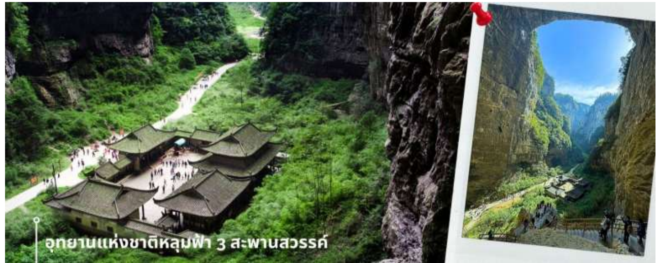
CHUCKG5 ฉงชิ่ง อู่หลง หลุมฟ้า ต้าจู๋ หยงหยาดัง 5 วัน 4 คืน บิน HAINAN AIRLINES (HU)

เช้า รับประทานอาหารเช้า ณ ห้องอาหารของโรงแรมที่พัก (2) หลังรับประทานอาหารเช้า นำท่านเดินทางสู่ เมืองอู่หลง (ใช้เวลาเดินทางประมาณ 3 ชั่วโมง) จากนั้นนำท่านเข้าชม อุทยานแห่งชาติหลุมฟ้า 3 สะพานสวรรค์ (รวมลิฟท์แก้ว+รถอุทยาน+รถแบตเตอรี่+ระเปียงกระจก) เป็นมรดกโลกทางธรรมชาติระดับ 5A ที่มีความสวยงามมากที่สุดแห่งหนึ่ง ตั้งอยู่ที่เมืองอู่หลง นครฉงชิ่ง ประเทศจีน เกิดจากการยุบตัวของเปลือกโลก ทำให้เกิดเป็นบ่อหลุมขนาดใหญ่ที่ลึกประมาณ 300-500 เมตร และมีบางส่วนเป็นโพรงทะลุ เหมือนกับสะพานทอดข้ามระหว่างภูเขาจึงเป็นที่มาของคำว่า "หลุมฟ้า 3 สะพานสวรรค์" การลงไปหลุมฟ้าจะต้องลงลิฟท์