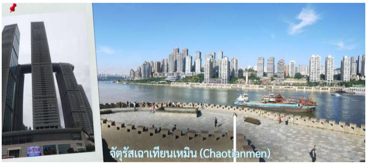
จัตุรัสเฉาเทียนเหมิน (Chaotianmen)

จุดบรรจบระหว่างแม่น้ำสองสาย โดยน้ำสีเหลืองของแม่น้ำแยงซีและน้ำสีเขียวมรกตของแม่น้ำเจียหลิงไหลมาบรรจบกันอย่างชัดเจน สร้างทัศนียภาพที่สวยงามและเป็นเอกลักษณ์ของฉงชิ่งอย่างแท้จริง