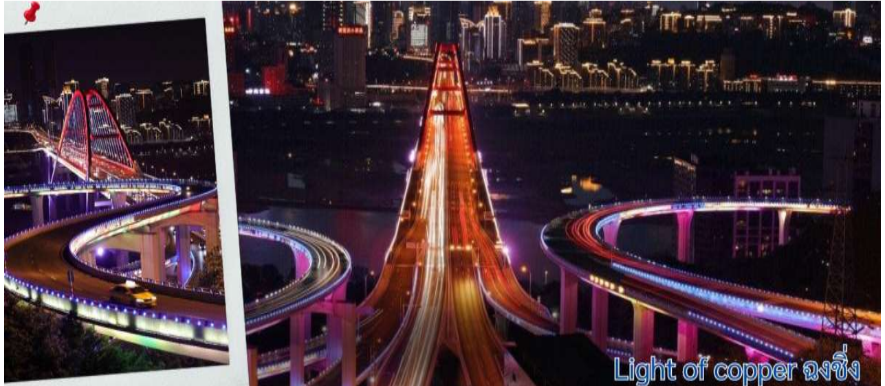
Light of copper ฉงชิ่ง

แวะถ่ายรูปวิวที่ Light of copper ฉงชิ่ง เป็นจุดชมวิวชื่อดังในมหานคร ฉงชิ่ง ประเทศจีน ซึ่งได้รับความนิยมอย่างมากในกลุ่มนักท่องเที่ยวและช่างภาพ จุดชมวิวยังยกระดับโดดเด่นด้วยทางเดินลอยฟ้าทรงกลมที่เชื่อมต่อกันสามารถมองเห็นวิวพาโนรามาของ สะพานซูเจียปา (Sujiaba Interchange) ที่โค้งไปมาอย่างซับซ้อน และสะพานข้ามแม่น้ำแยงซีเกียง ไช่หยวนปา (Caiyuanba Bridge) ท่ามกลางตึกสูงระฟ้าบรรยากาศยามค่ำคืน เมื่อเปิดไฟเมืองในช่วงค่ำจะเห็นแสงสีทองและสีทองแดงสะท้อนความงดงามของ "เมืองภูเขา" ได้อย่างชัดเจน