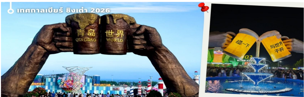
CVZYNT3 เยียนไถ -ซิงเต่า 6วัน 5คืน VZ VietjetAir (ทัวร์ไม่ลงร้าน)

🏠 GOLDEN TULIP QINGDAO/ HOLIDAY INN EXPRESS YANTAI 4 ดาวหรือเทียบเท่า