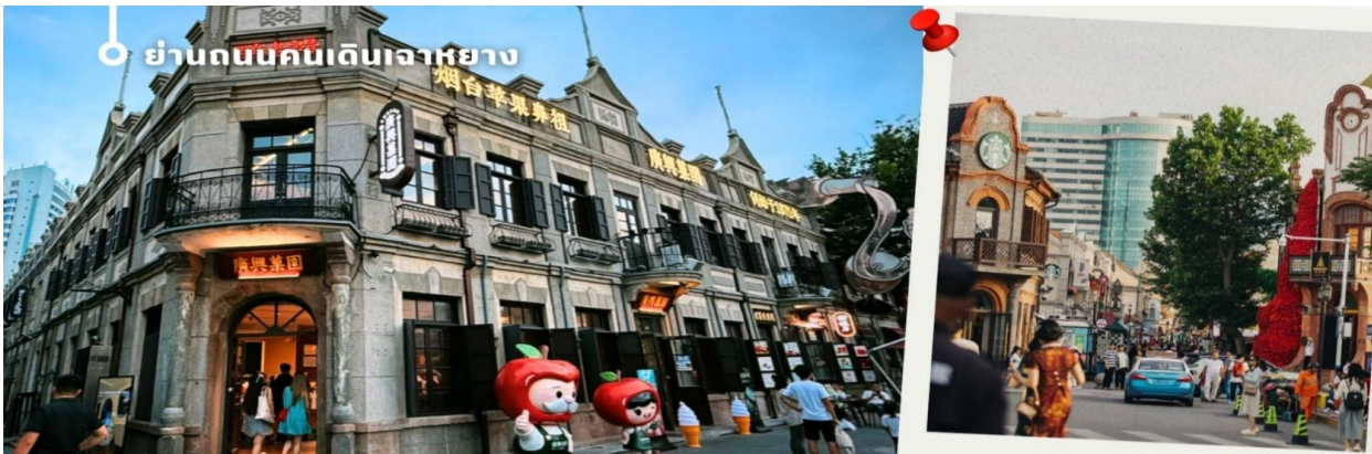
CVZYNT3 เยียนไถ -ซิงเต่า 6วัน 5คืน VZ VietjetAir (ทัวร์ไม่ลงร้าน)

นำท่านเช็คอินย่านฮิต ของเมืองเยียนไถ ย่านถนนคนเดินเฉาหยาง (Chaoyang Walking Street) ใจกลางเมืองเยียนไถ ย่านเก่าแก่ที่สะท้อนเสน่ห์ของเมืองผ่านสถาปัตยกรรมผสมผสานระหว่างยุโรปและจีนดั้งเดิม สร้างบรรยากาศคลาสสิกที่ยังคงความมีชีวิตชีวาในแบบร่วมสมัยตลอดเส้นทางถนนที่ทอดยาวประมาณ 400 เมตร รายล้อมด้วยร้านค้า คาเฟ่ ร้านอาหาร และสตรีทฟู้ดให้เลือกหลากหลาย เหมาะสำหรับการเดินชมเมือง ชิมอาหารท้องถิ่น และสัมผัสวิถีชีวิตยามค่ำคืนของชาวเยียนไถ ท่ามกลางแสงไฟที่ประดับสวยงามทั่วทั้งย่าน กลายเป็นอีกหนึ่งจุดเช็คอินยอดนิยม