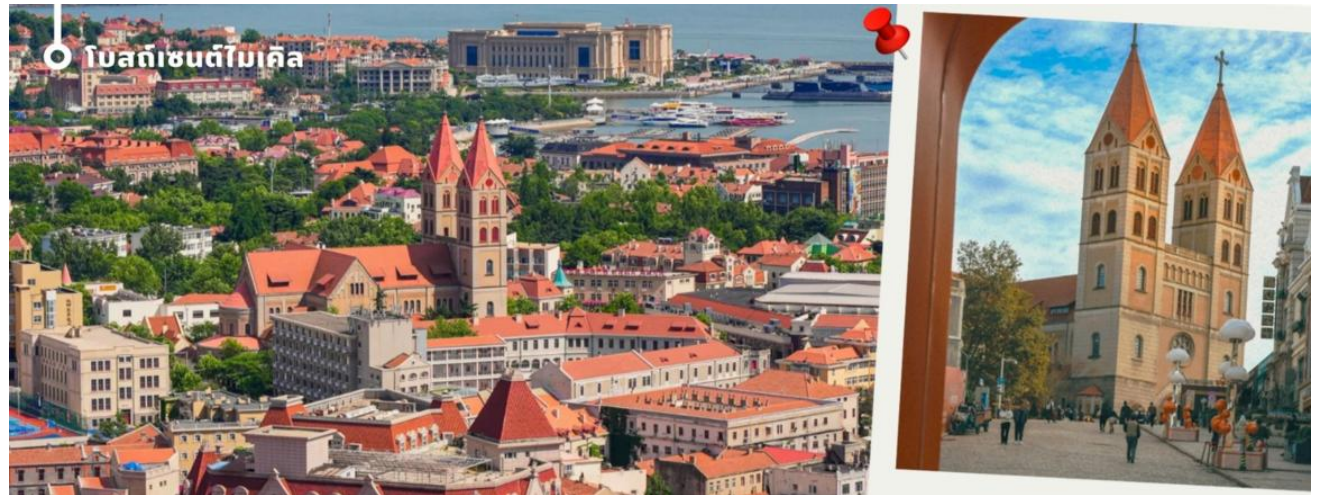
โบสถ์เซนต์ปีเตอร์

นำท่านเดินเล่น ถนนจงซาน (Zhongshan Road) ย่านการค้าเก่าแก่และถนนสายประวัติศาสตร์ที่ได้รับการขนานนามว่าเป็น “ถนนแม่แห่งเมืองชิงเต่า” โดดเด่นด้วยอาคารสถาปัตยกรรมสไตล์ยุโรปอันสวยงามที่ผสมผสานเสน่ห์ของอดีตและความทันสมัยได้อย่างลงตัว เพลิดเพลินกับการเลือกซื้อสินค้าแฟชั่น สินค้าท้องถิ่น และของฝากจากร้านค้าชื่อดังมากมายตลอดสองข้างทาง พร้อมสัมผัสบรรยากาศสุดโรแมนติก เหมาะแก่การเดินเล่น ถ่ายภาพเช็คอิน และเก็บความประทับใจท่ามกลางเมืองท่าริมทะเลที่มีเสน่ห์แห่งนี้ นับเป็นอีกหนึ่งจุดหมายยอดนิยมที่ไม่ควรพลาดเมื่อมาเยือนเมืองชิงเต่า