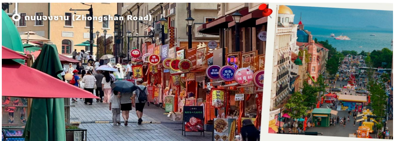
ถนนจงซาน (Zhongshan Road)

นำท่านเดินเล่น ถนนจงซาน (Zhongshan Road) ย่านการค้าเก่าแก่และถนนสายประวัติศาสตร์ที่ได้รับการขนานนามว่าเป็น “ถนนแม่แห่งเมืองชิงเต่า” โดดเด่นด้วยอาคารสถาปัตยกรรมสไตล์ยุโรปอันสวยงามที่ผสมผสานเสน่ห์ของอดีตและความทันสมัยได้อย่างลงตัว เพลิดเพลินกับการเลือกซื้อสินค้าแฟชั่น สินค้าท้องถิ่น และของฝากจากร้านค้าชื่อดังมากมายตลอดสองข้างทาง พร้อมสัมผัสบรรยากาศสุดโรแมนติก เหมาะแก่การเดินเล่น ถ่ายภาพเช็คอิน และเก็บความประทับใจท่ามกลางเมืองท่าริมทะเลที่มีเสน่ห์แห่งนี้ นับเป็นอีกหนึ่งจุดหมายยอดนิยมที่ไม่ควรพลาดเมื่อมาเยือนเมืองชิงเต่า