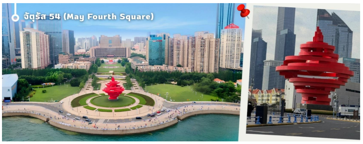
จัตุรัส 54 (May Fourth Square)

นำท่านเดินทางสู่ จัตุรัส 54 แลนด์มาร์กสำคัญและสัญลักษณ์ประจำเมืองชิงเต่า ตั้งอยู่ริมอ่าวฝูซาน โดดเด่นด้วยประติมากรรมสีแดงขนาดยักษ์ "สายลมแห่งเดือนพฤษภาคม" ซึ่งสร้างขึ้นเพื่อรำลึกถึงขบวนการ 4 พฤษภาคม อันเป็นเหตุการณ์สำคัญในประวัติศาสตร์จีน นักท่องเที่ยวสามารถเดินเล่นริมทะเล ชมวิวเมืองสมัยใหม่ และสัมผัสบรรยากาศอันสวยงามของอ่าวฝูซาน โดยเฉพาะในช่วงค่ำที่มีการเปิดไฟประดับทั่วบริเวณ ถือเป็นจุดชมวิวและถ่ายภาพที่มีชื่อเสียงที่สุดแห่งหนึ่งของเมืองชิงเต่า