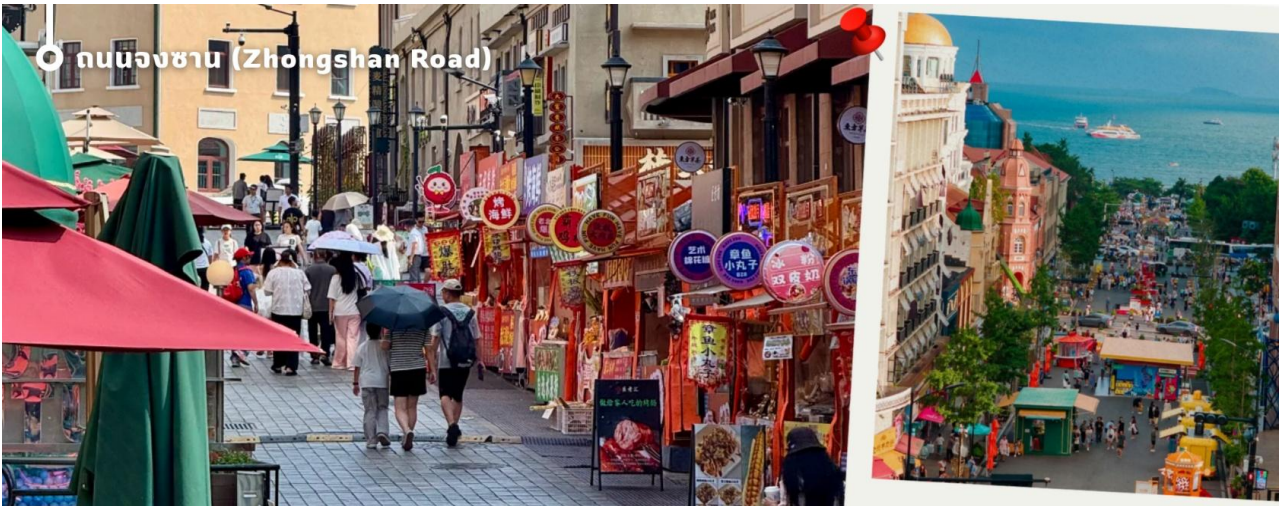
ถนนจงซาน (Zhongshan Road)

นำท่านชม ถนนจงซาน (Zhongshan Road) ย่านการค้าเก่าแก่และถนนสายประวัติศาสตร์ที่ได้รับการขนานนามว่าเป็น “ถนนแม่แห่งเมืองชิงเต่า” โดดเด่นด้วยอาคารสถาปัตยกรรมสไตล์ยุโรปอันสวยงามที่ผสมผสานเสน่ห์ของอดีตและความทันสมัยได้อย่างลงตัว เพลิดเพลินกับการเลือกซื้อสินค้าแฟชั่น สินค้าท้องถิ่น และของฝากจากร้านค้าชื่อดังมากมายตลอดสองข้างทาง พร้อมสัมผัสบรรยากาศสุดโรแมนติก เหมาะแก่การเดินเล่น ถ่ายภาพเช็คอิน และเก็บความประทับใจท่ามกลางเมืองท่าริมทะเลที่มีเสน่ห์แห่งนี้