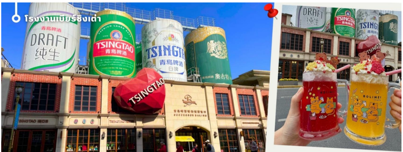
CVZYNT4 เอียนโล-เวย์ไห่-ชิงเต่า 6วัน 5คืน VZ VietjetAir (ทัวร์ไม่ลงร้าน)_Aug26-Feb27

นำท่านสู่ ย่านไทดง (Taidong Pedestrian Street) ย่านถนนคนเดินชื่อดังของเมืองชิงเต่า ที่มีประวัติศาสตร์ยาวนานกว่า 120 ปี เดิมเป็นย่านการค้าเก่าแก่ ก่อนพัฒนาเป็นศูนย์กลางความคึกคักและถนนคนเดินยอดนิยมในปัจจุบันเพลิดเพลินกับบรรยากาศสุดมีชีวิตชีวา ท่ามกลางตึกแถวที่ตกแต่งด้วยงานกราฟิตี้สีสันสดใส กลายเป็นแลนด์มาร์กถ่ายภาพสุดฮิตที่ผสมผสานศิลปะและความทันสมัยได้อย่างลงตัวสัมผัส สวรรค์ของนักชิม (Foodie