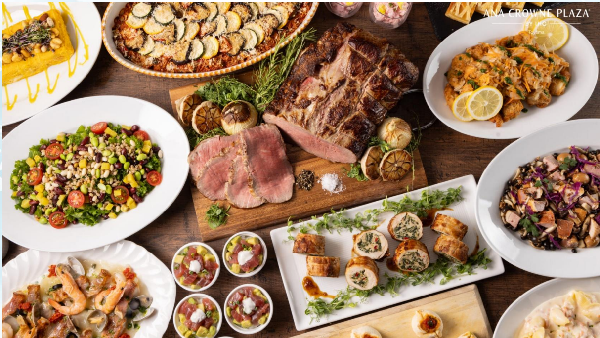
GO2KIX-TG096 -- TOYAMA HAKUBA TOKYO SKI NEW YEAR 7D 4N BY [TG]

สวนสาธารณะคันซุย (Kansui Park) เป็นโอเอซิสกลางเมืองที่มาพร้อมพื้นที่โล่งกว้าง สนามหญ้าสีเขียว และคลองที่งดงาม ปลายสะพานมีหอคอยชมวิวที่ทำจากอิฐตั้งอยู่แต่ละฝั่ง สามารถชมวิวสวนและภูเขาหยาเตยามะอันกว้างไกลได้ ไฮไลต์สำคัญคือ Starbucks Toyama Kansui Park ที่ได้ชื่อว่าเป็น Starbucks ที่สวยที่สุด ตัวร้านตั้งอยู่ริมคลองที่สะท้อนเงาท้องฟ้าและ สะพาน Fugan Suijo Line ได้อย่างงดงาม ด้วยกระจกใสบานใหญ่รอบร้าน ทำให้สามารถมองเห็นวิวธรรมชาติที่เปลี่ยนไปตามฤดูกาล เช่น ใบไม้เปลี่ยนสีในฤดูใบไม้ร่วง หิมะขาวในฤดูหนาว หรือสีเขียวข่มของฤดูร้อน