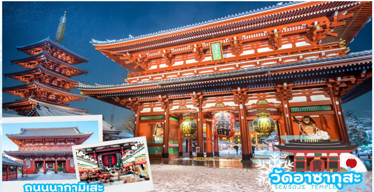
ถนนนากามิเสะ

เช้า รับประทานอาหารเช้า ณ ห้องอาหารโรงแรม (มื้อที่ 11)