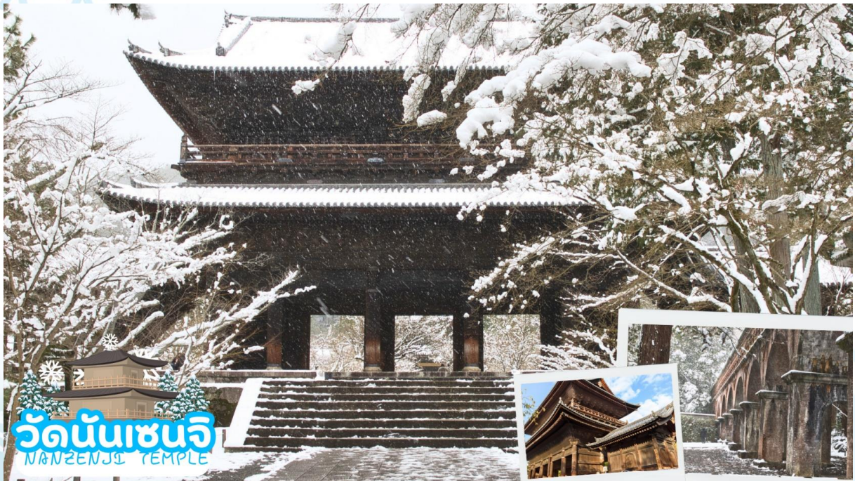
วัดนันเซ็นจิ NANZENJI TEMPLE

เดินทางสู่ เมืองเกียวโต (Kyoto) ซึ่งในอดีตเคยเป็นเมืองหลวงของประเทศญี่ปุ่น และยาวนานที่สุด คือ ตั้งแต่ปี ค.ศ. 794 จนถึง 1868 รวม ๆ 1,100 ปีเลยทีเดียว เมืองเกียวโตจึงเป็นเมืองที่มีสถานที่สำคัญ ๆ ที่เต็มไปด้วยประวัติศาสตร์และวัฒนธรรมดั้งเดิมของญี่ปุ่น