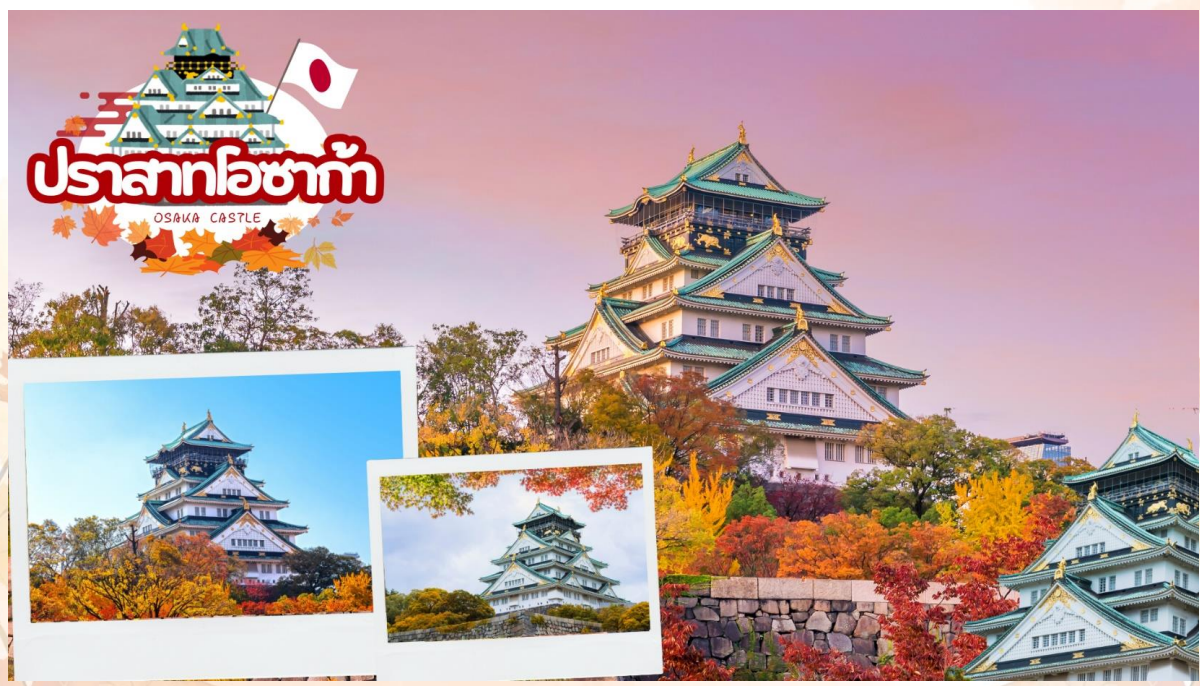
GO2NGO-TG092 – MIE KYOTO OSAKA AQUARIUM AUTUMN 6D 4N BY TG

ตลาดคุโรมง (Kuromon Market) ตั้งอยู่ใจกลางโอซาก้า ตลาดปลาโอซาก้าแห่งนี้ที่มีความเป็นมาอย่างยาวนาน ตั้งแต่ยุคเมจิ เมื่อ 100 กว่าปีก่อน ถือเป็นตลาดเก่าแก่เป็นอันดับต้น ๆ แห่งหนึ่ง นอกจากปลาและอาหารทะเลแล้ว ที่นี่ยังเป็นแหล่งรวมวัตถุดิบคุณภาพของโอซาก้าและแถบข้างเคียง จึงได้รับสมญานามว่าเป็น “ครัวแห่งโอซาก้า” และสัญลักษณ์ที่ทำให้หลาย ๆ คนจดจำที่นี่ได้ คือ ใต้หลังคาของตลาดจะมีสัตว์ทะเล อาทิ ปลาหมึก ปลา และปู โดยตลาดนี้ประกอบด้วยร้านต่าง ๆ กว่า 170 ร้าน ทั้งร้านขายอาหารสด อาหารพร้อมทาน ผักผลไม้ และของใช้ต่าง ๆ ให้ท่านได้เลือกซื้อ