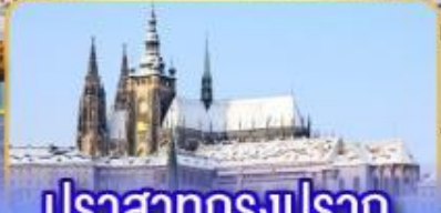
ปราสาทกรุงปราก