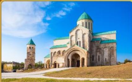
มหาวิหารบากราติ