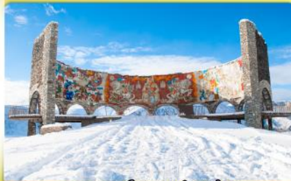
อนุสรณ์สถานรัสเซีย