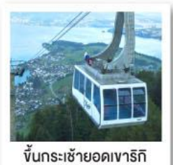
ขัั้นกระเช้ายอดเขารีกิ