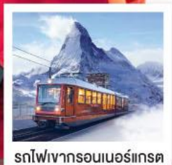
รถไฟเขารอนเนอร์เกรต