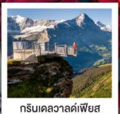
กรีนเดลวาลด์เฟียส