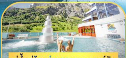
แช่น้ำแร่ร้อนผ่อนคลายลวยเคอร์บัต