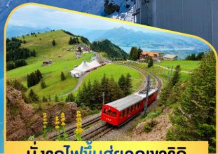
นั่งรถไฟขึ้นสู่ยอดเขาจาร์กิก