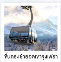
ขึ้นกระเช้ายอดเขาจุงเฟรา