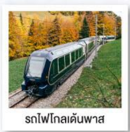
รถไฟโกลเดนพาส