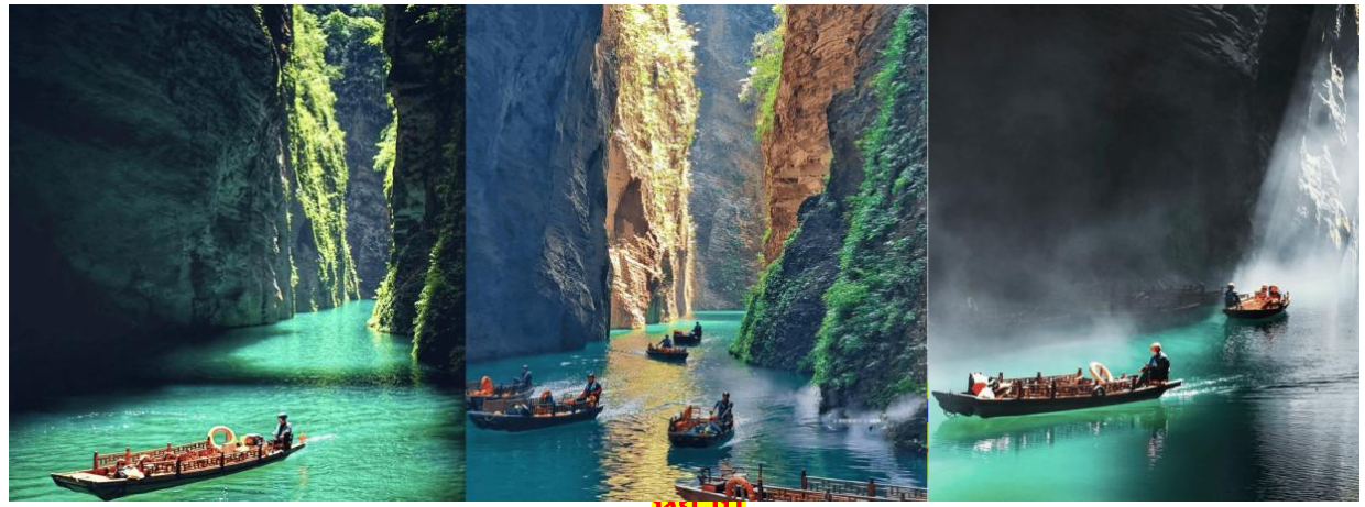
ทั้งนี้ขึ้นอยู่กับแพ็คเกจที่เลือกใช้บริการ**

เช้า ๒๐ | บริการอาหารเช้า ณ ห้องอาหารของโรงแรม หลังจากนั้นนำทุกท่านเดินทางสู่ "แกรนด์แคนยอนผิงซาน" (Pingshan Grand Canyon) (รวมรถอุทยาน+ค่าล่องเรือไป-กลับ) (ใช้เวลาเดินทางประมาณ 3 ชั่วโมง) ตั้งอยู่ในเมืองเฉินซือ ขึ้นชื่อเรื่องทิวทัศน์หุบเขาหินทรายสีแดงและแม่น้ำที่ใสสะอาดที่สุดแห่งหนึ่ง ไฮไลท์คือการล่องเรือชมวิวน้ำสูงชันและน้ำที่สะท้อนเงาภูเขาจนดูเหมือนเรือลอยอยู่บนอากาศ เป็นสถานที่ท่องเที่ยวทางธรรมชาติระดับ AAAA หลังจากนั้นก็พานำทุกท่านล่องเรือชมความงามของแกรนด์แคนยอนผิงซาน(รวมรถอุทยาน+รวมค่าล่องเรือชมทัศนียภาพแกรนด์แคนยอน)