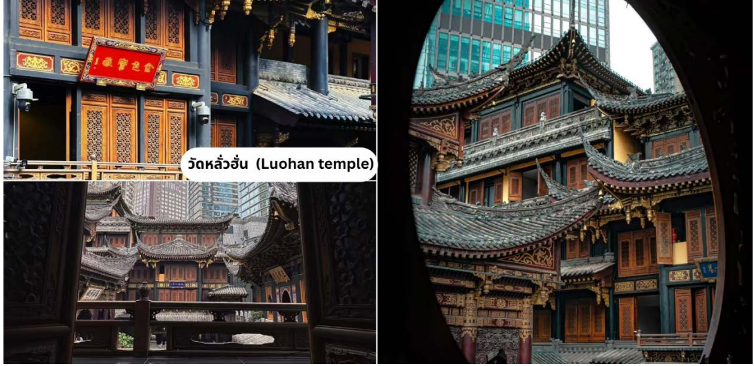
วัดหลัวฮั่น (Luohan temple)

นำท่านเดินทางสู่ วัดหลัวฮั่น (Luohan Temple) ตั้งอยู่บนถนนหนามินซู เป็นวัดเก่าแก่ตั้งอยู่ใจกลางเมืองฉงชิ่ง สร้างขึ้นในสมัยจื้อผิงแห่งราชวงศ์ซ่งเหนือ ภายในวัดมีสถาปัตยกรรมสวยงามทุกจุด มีรูปปั้นพระพุทธรูป และรูปปั้นพระอรหันต์ 500 องค์ ประดิษฐานอยู่ภายในกำแพง และมีภาพจิตรกรรมฝาผนังให้ท่านได้เดินชมความสวยงาม