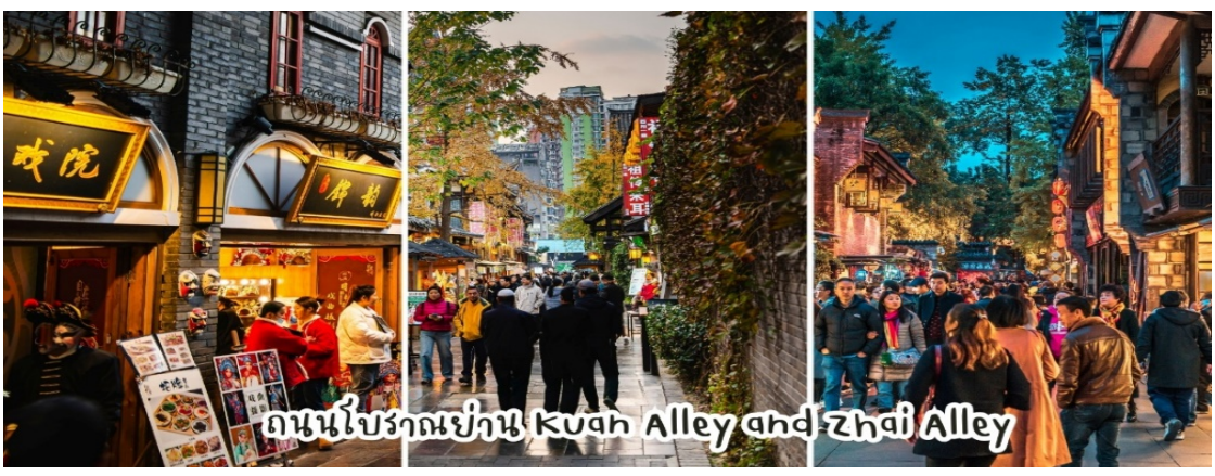
ถนนโบราณอย่าง Kuan Alley and Zhai Alley

จากนั้นนำท่านเดินทาง ช้อปปิ้งชอยกว้างชอยแคบ เป็นถนนที่แสดงถึงเสน่ห์ของการตกแต่งด้วยเรื่องราววิถีชีวิตการเป็นอยู่ของคนจีนเฉิงตูในสมัยโบราณ ที่มีการผสมความเป็นทันสมัยเข้าไปอย่างลงตัว ถนนคนเดินมี 3 ซอย แต่ละซอยมีความยาวประมาณ 400 เมตร มีร้านค้าเล็กๆ ตั้งเรียงรายอยู่ในแต่ละซอยและตรอกให้เดินช้อปปิ้งเพลิน ทั้งร้านหนังสือ ร้านชา-กาแฟ บาร์ เสื้อผ้า ไปจนถึงร้านอาหารนานาชาติ มีจำหน่ายสินค้าพื้นเมือง ขนม ร้านอาหาร รวมทั้งของฝากให้ท่านได้ถ่ายรูปและเลือกซื้อ