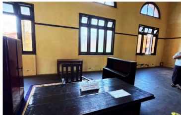
ตึกเก่า The secretariat yangon