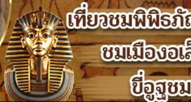
เที่ยวชมพิพิธภัณฑ์แกรนด์อียิปต์ ชมเมืองอเล็กซานเดรีย ขี่อูฐชมพีระมิด

เดินทาง 22-27 ก.ย. 69 29 ก.ย.-04 ต.ค. 69