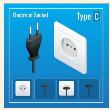
ปลั๊กไฟที่ใช้ที่อียิปต์