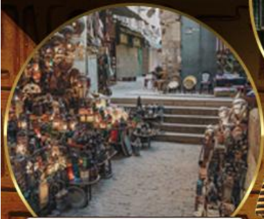
ตลาดข่านเอลคาลิลี