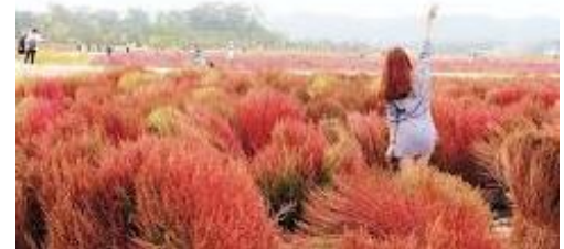
(ดอกเล็กๆสีขาวอมชมพู) แข่งกันชูช่อ

จากนั้นนำท่านชมความงดงาม สวนยางจูนาริ(Yangju Nari Park) ท่านจะได้ชมความสวยงามของบรรดาดอกไม้ ดอกหญ้า ที่เปลี่ยนสีในช่วงฤดูใบไม้เปลี่ยนสีท่านจะได้ถ่ายทำมกลางทุ่งดอกหญ้า อาทิ สวนดอกหญ้า Pink Muhly และ ที่พลาดไม่ได้เลย คือ Globe Amaranth (ดอกบานไม่รู้โรย),Kochia (ทุ่งต้นโคเคีย ดอกหญ้าไม้กวาดหรือ ที่คนไทยเรียกกันว่า ดอกโคเคีย),Whirling Butterflies