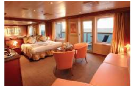
Grand Suite (GS) (for 2 to 3 people)

48.3 sq m (519.89 sq ft) 1 double bed or 2 single beds 1 sofa bed Dressing room Bathroom with shower & Jacuzzi