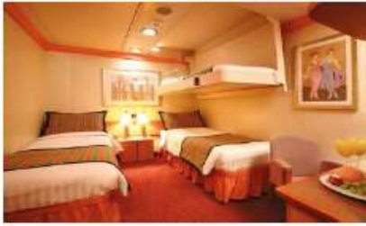
Inside Classic (IC) Inside Premium (IP) (for 2 to 4 people)