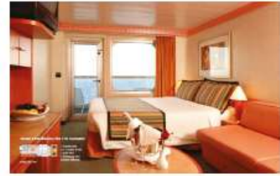
Balcony Classic (BC) Balcony Premium (BP) (for 2 to 4 people)

17.7 sq m (190.52 sq ft) 1 double bed or 2 single beds 1 foldaway bed Window (non open)