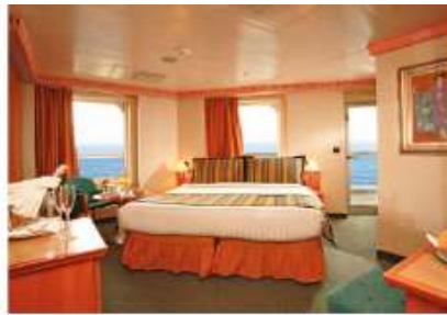
Mini Suite with Oceanview Balcony (MS) (for 2 to 3 people)

31.3 sq m (336.91 sq ft) 1 double bed or 2 single beds 1 sofa bed Bathroom with shower & Jacuzzi