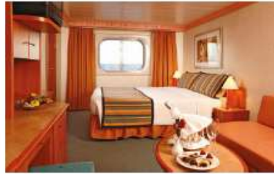
Oceanview Classic (EC) Oceanview Premium (EP) (for 2 to 4 people)

13.9 sq m (149.6 sq ft) 1 double bed or 2 single beds 2 foldaway beds