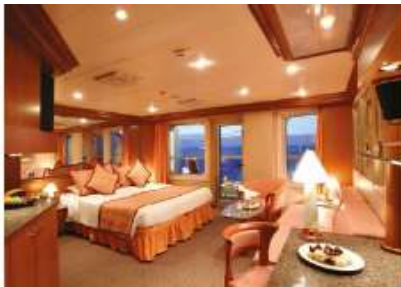
Suite with Oceanview Balcony (S) (for 2 to 3 people)

20.4 sq m (219.58 sq ft) 1 double bed or 2 single beds 1 foldaway bed 1 sofa bed