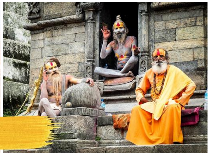
วัดปศุภินาถ