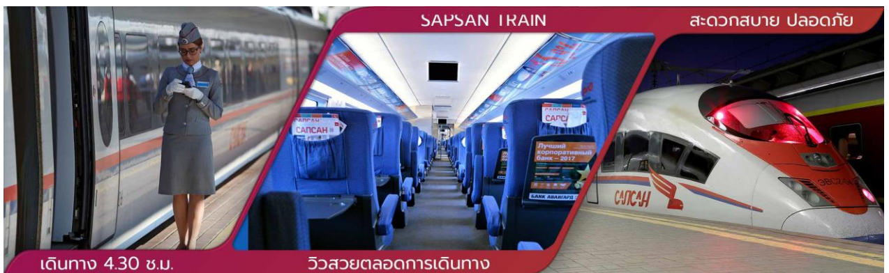
เดินทาง 4.30 ชม.

(ตารางเดินรถอาจมีการเปลี่ยนแปลง กรุณาตรวจสอบกับหัวหน้าทัวร์อีกครั้ง)