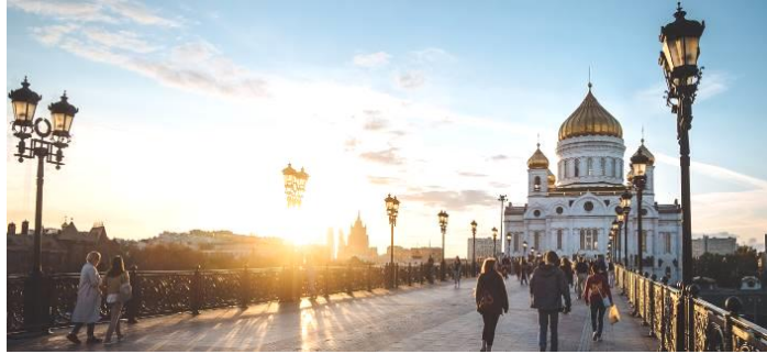
** อีสระอากาศค่า เพื่อสะดวกแก่การเดินทางท่องเที่ยว **

** หากมีพิธีกรรมทางศาสนา มหาวิหารเซนต์ซาเวียร์ จะไม่อนุญาตให้เข้าชมด้านใน **