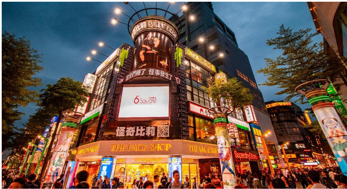
อิสระอาหารเย็นตามอัธยาศัย ที่ Ximending Night Market