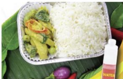
Green curry chicken with rice and water