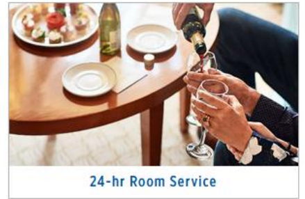
24-hr Room Service