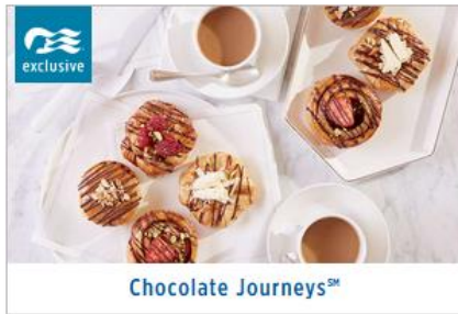
Chocolate Journeys SM