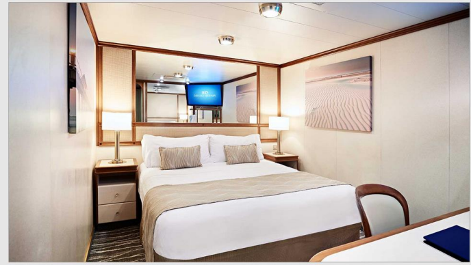
ห้องพักแบบมีระเบียง (Balcony Cabin)