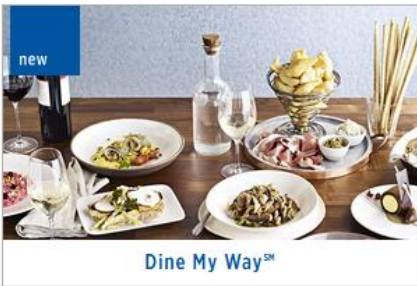
Dine My Way SM