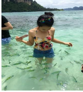
ชมทะเลแหวก Unseen in Thailand เชื่อมระหว่าง เกาะทับ และ เกาะหม้อ