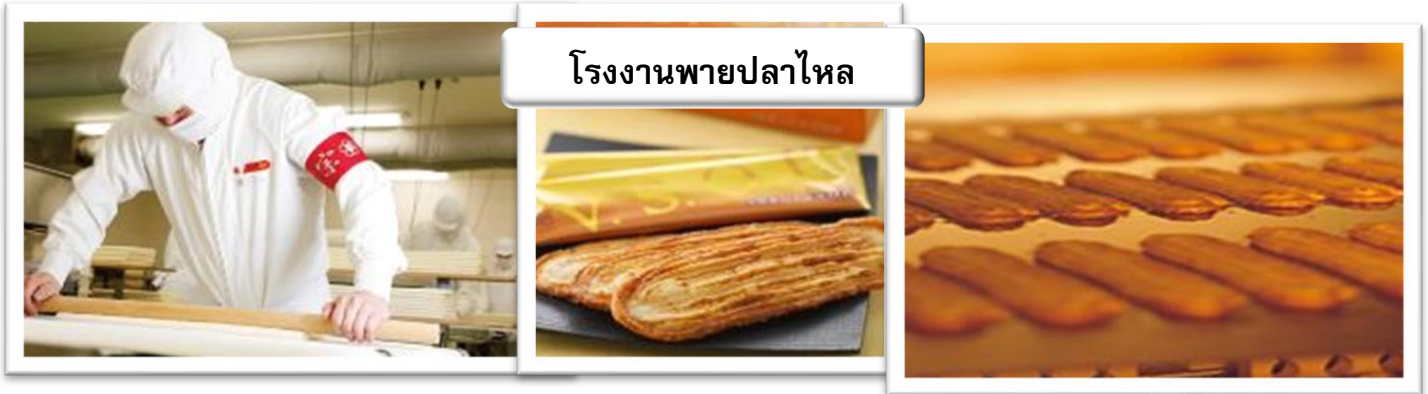
โรงงานพวยปลาไหล