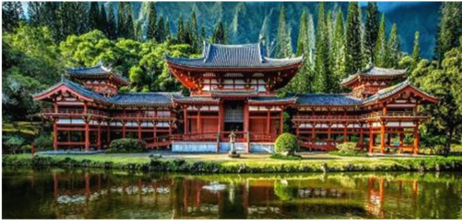
วัดเบียวโดอิน

จากวัด Byodo-in เดินต่ออีกเพียง 5 นาที จะถึง ถนนซาเซียว ที่มีร้านขายผลิตภัณฑ์ที่ทำจากซาเซียวหลาย แห่งทั้งสองฝากทางแวะชิมซอฟต์ครีมซาเซียวหวานละมุนลิ้น