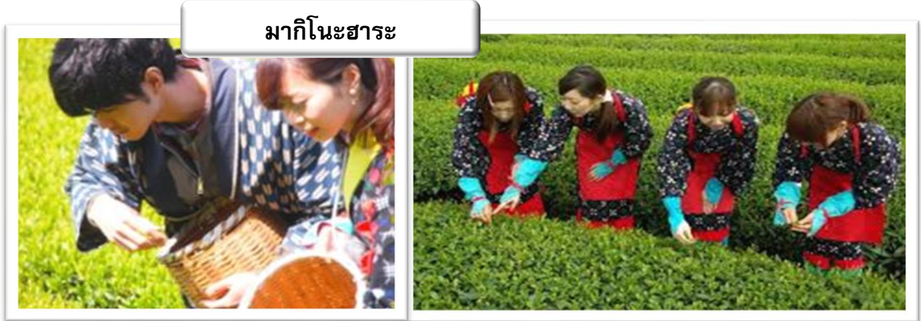
มากิโนะฮาระ

ภายใต้คอนเซ็ปต์เกี่ยวกับชาที่ให้ผู้มาเยือนได้สนุกสนานกับการช้อปปิ้งและกิจกรรมต่างๆ มากมาย ในช่วงตั้งแต่เดือนพฤษภาคม - ต้นเดือนตุลาคมของทุกปีจะมี “กิจกรรมเก็บใบชา” ให้ท่านได้เด็ดยอดใบชาสดๆ จากไร่ และใบชาที่เด็ดมานั้นยังสามารถนำกลับบ้านไปได้อีกด้วย นับเป็นประสบการณ์ที่หาได้ค่อนข้างยากแม้ในแหล่งผลิตชาเขียวอย่างชิซูโอกะเองก็ตาม จึงไม่ควรพลาดเลยทีเดียว อีกทั้งท่านยังสามารถเข้าชมภายในโรงงานผลิตใบชาซึ่งตั้งอยู่ภายในกรีนเพีย มากิโนะฮาระ (Grinpia Makinohara) และสามารถซื้อหาชาเขียว “เซ็นฉะ (Sencha / ใบชาที่เป็นที่นิยมมากที่สุดใญี่ปุ่น ไม่ผ่านการหมัก รสชาติกลมกล่อม)” และขนมชนิดต่างๆ ที่รับประทานคู่กับน้ำชาได้อีกด้วย