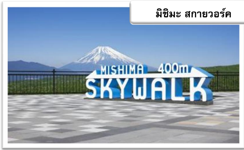
มิชิมะ สกายวอล์ค

นำท่านเข้าสู่ที่พัก HATOYA ONSEN HOTEL หรือเทียบเท่า