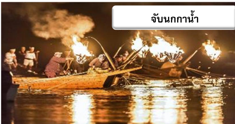
จับนกกาหน้า

จากนั้นนำท่านชม การจับปลาแบบอุโก หรือการจับปลาด้วยนกกาหน้าในแม่น้ำนะงะระที่ใสสะอาด เป็นภาพ หนึ่งซึ่งพบเห็นได้บ่อยที่สุดในช่วงฤดูร้อนของเมืองกิฟุ การจับปลาด้วยนกกาหน้าในแม่น้ำนะงะระกระทำกันทุกคืน ในช่วงฤดูดังกล่าว ตั้งแต่วันที่ 11 พฤษภาคมไปจนถึงวันที่ 15 ตุลาคม ยกเว้นช่วงคืนวันเพ็ญใหญ่ฤดูเก็บเกี่ยว ซึ่ง ระดับน้ำในแม่น้ำเพิ่มสูงขึ้น การจับปลาแบบอุโกเป็นวิธีการจับปลาในเวลากลางคืนแบบดั้งเดิมที่อุโสะ (นักจับ ปลาแบบอุโก) และนกอุ (นกกาหน้า) ร่วมกันจับปลาโดยใช้แสงไฟจากคองะริบิ (คบไฟจับปลา) ซึ่งสะท้อนบนผิว แม่น้ำที่มีดมิต