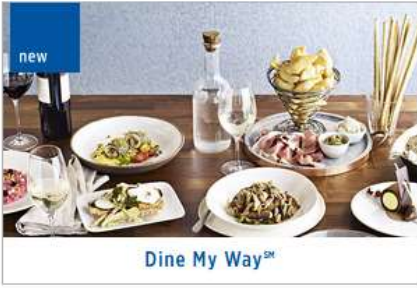
Dine My Way™