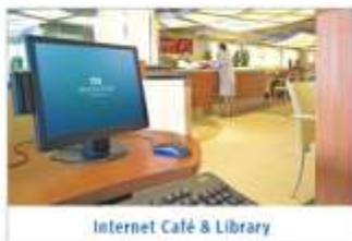
Internet Café & Library