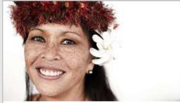
Festivals of the World