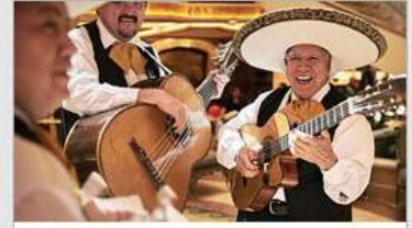
Music & Dancing