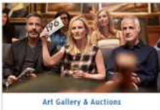
Art Gallery & Auctions