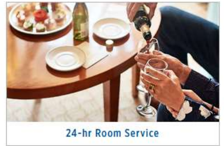
24-hr Room Service