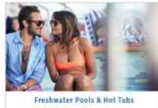
Freshwater Pools & Hot Tubs