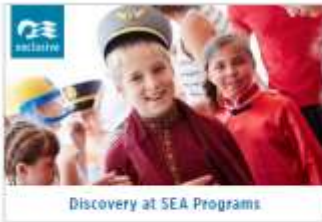
Discovery at SEA Programs