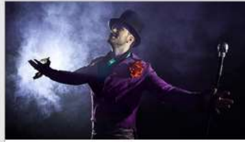
Featured Guest Entertainers