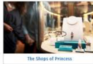
The Shops of Princess