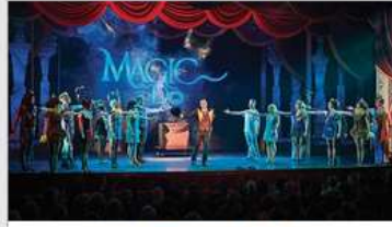
Original Musical Productions