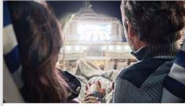
Movies Under the Stars®