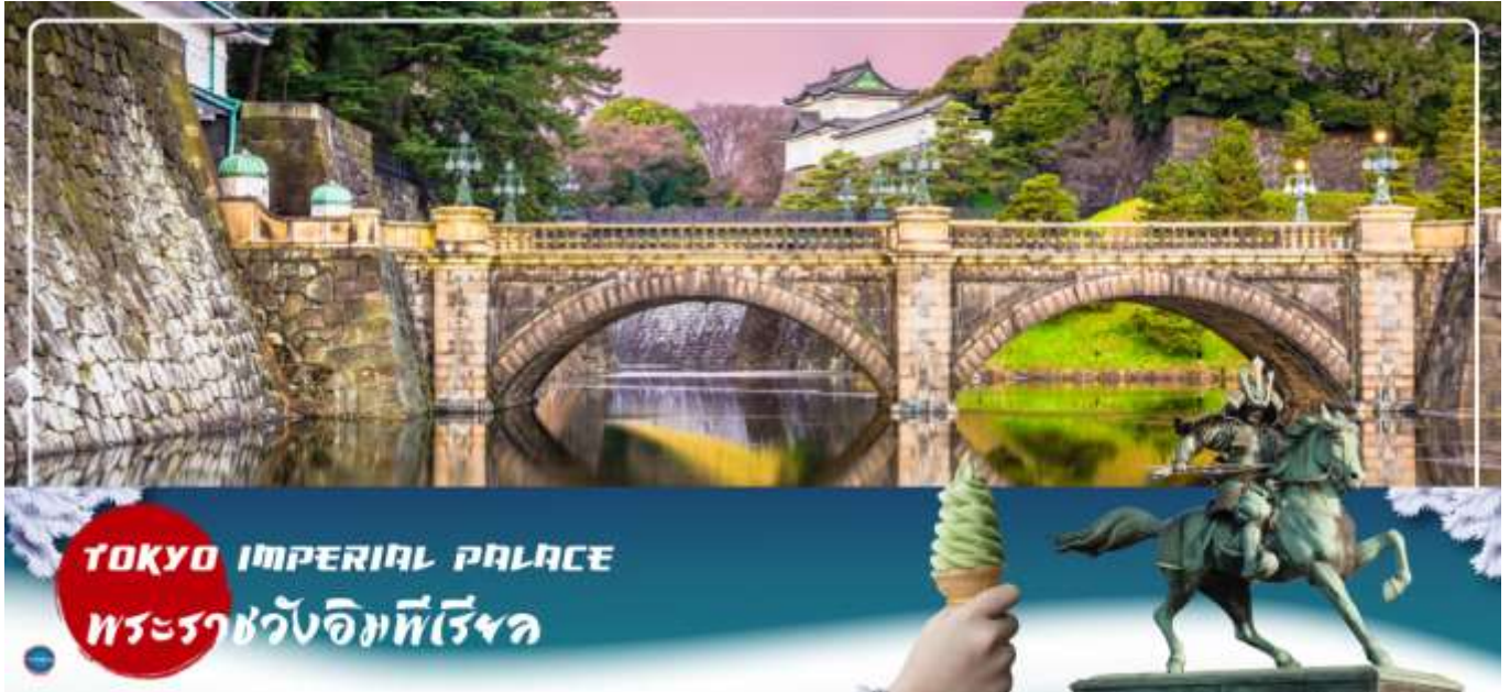
TOKYO IMPERIAL PALACE พระราชวังอิมพีเรียล

นำท่านเดินทางสู่ พระราชวังอิมพีเรียล (Imperial Palace) (ชมและถ่ายภาพด้านนอก) (ใช้เวลาเดินทางโดยประมาณ 20 นาที) เป็นที่ประทับของสมเด็จพระจักรพรรดิแห่งญี่ปุ่น ภายในพื้นที่กว้างใหญ่ประกอบด้วยพระตำหนักและอาคารต่างๆมากมาย ชม สะพานนิจูบashi (Nijubashi Bridge) หรือสะพานแวนดา เส้นโค้งของสะพานข้ามคูน้ำสู่พระราชวังแห่งกรุงโตเกียว ที่มีชื่อเรียกว่า แวนดาก็เพราะส่วนโค้งที่อยู่ติดกันด้านล่างสะพานนั้นมีรูปร่างเหมือนแวนดาเมื่อสะท้อนกับผิวน้ำ ส่วนทางด้านหน้าพระราชวังเป็นอุทยานแห่งชาติโคเคียวไกเอ็น (Kokyo Gaien National Garden) เป็นสวนสาธารณะขนาดใหญ่