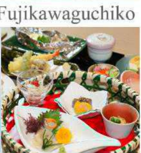
Yukari No Mori Fujikawaguchiko