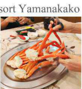
Hotel Alexander Royal Resort Yamanakako