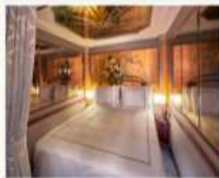
Palace Suite พื้นที่สูงสุด : 4 ไร่ ขนาด : 21 sq.m.