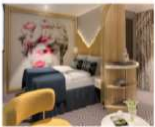
Palace Deluxe Suite พื้นที่สูงสุด : 4 ไร่ ขนาด : 37 sq.m.