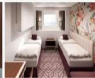
OceanView Stateroom พื้นที่สูงสุด : 2 ไร่ ขนาด : 13 sq.m.