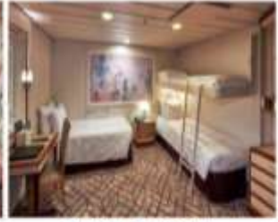
Balcony Stateroom พื้นที่สูงสุด : 4 ไร่ ขนาด : 18 sqm.

เราสามารถจองตั๋วเครื่องบินและที่พักเพิ่มเติมให้ท่าน รับประกันราคาถูก กรุณาติดต่อเจ้าหน้าที่