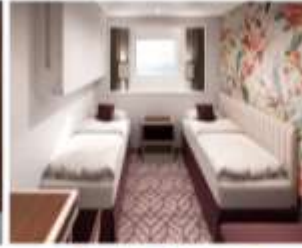
OceanView Stateroom พื้นที่สูงสุด : 2 ไร่ ขนาด : 13 sqm.