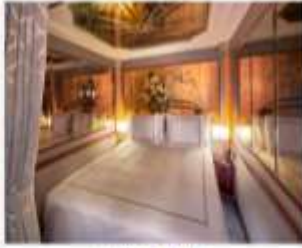
Palace Suite พื้นที่สูงสุด : 4 ไร่ ขนาด : 21 sqm.