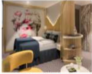
Palace Deluxe Suite พื้นที่สูงสุด : 4 ไร่ ขนาด : 37 sqm.