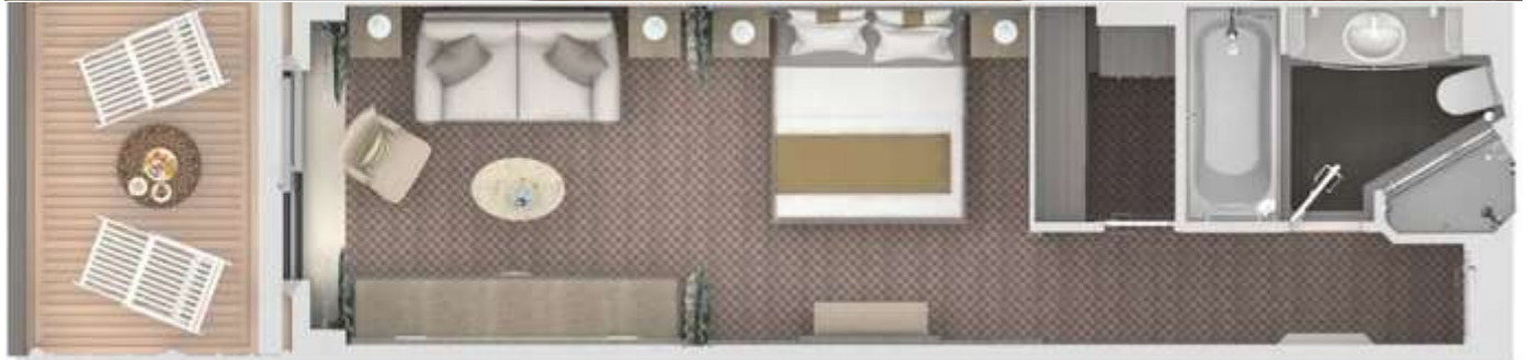
ห้องมีระเบียง Classic Veranda Suite : 36 m 2