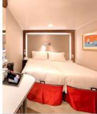
Interior Stateroom 402 Staterooms from 13 sq.m – 14 sq.m