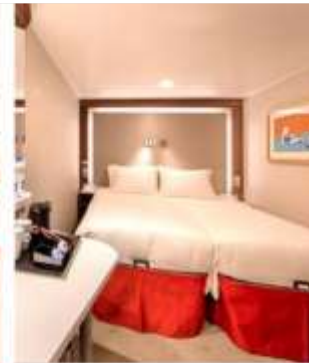
Interior Stateroom 402 Staterooms from 13 sq.m - 14 sq.m