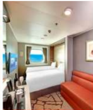
Oceanview Stateroom with Window 84 Staterooms from 16 sq.m - 35 sq.m