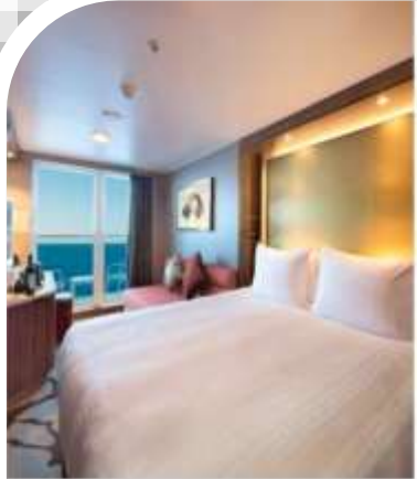
Oceanview Stateroom with Balcony