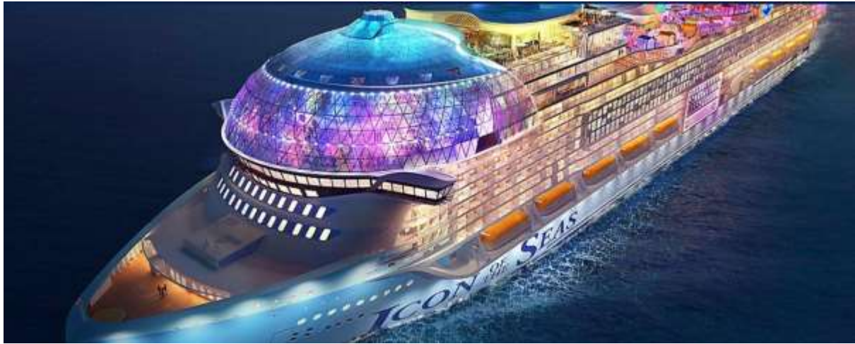
“ ICON OF THE SEAS “