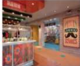
EL LOCO FRESH