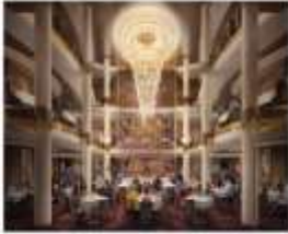
MAIN DINING ROOM

Royal Caribbean offers a myriad of casual dining options and quick bites for meals on the run.