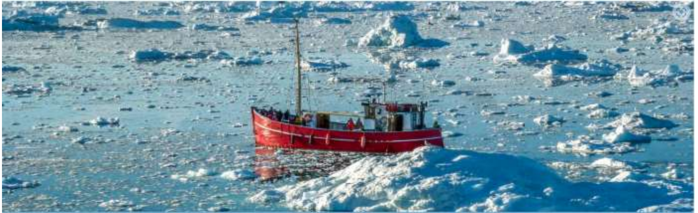
BOAT TRIP TO THE ICE-FJORD, ILULISSAT, GREENLAND

พิเศษ! ห้องพักที่ทางบริษัทจัดให้ จะมีระเบียงส่วนตัวทุกห้อง เพื่อให้ท่านได้ชมวิว และผ่อนคลายตลอดการเดินทาง