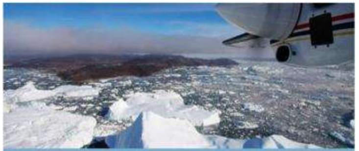
ICE-FJORD FLIGHT SIGHTSEEING, ILULISSAT, GREENLAND

* หมายเหตุ : ทัวร์โดยเครื่องบินเล็กนี้จะขายหมดอย่างรวดเร็ว ดังนั้นจำเป็นต้องจองล่วงหน้า