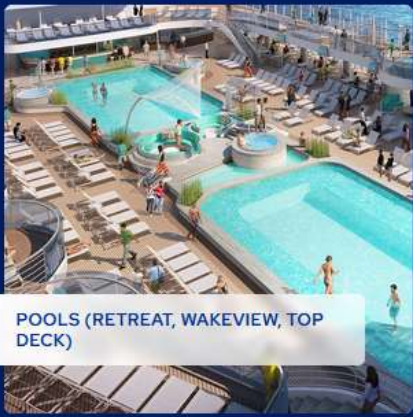
POOLS (RETREAT, WAKEVIEW, TOP DECK)