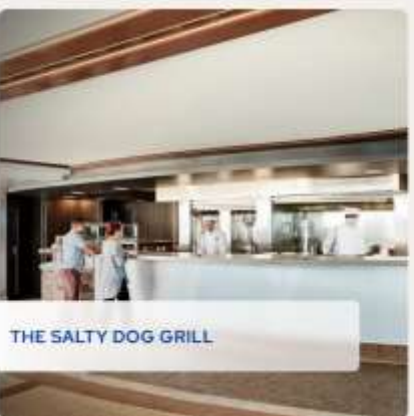
THE SALTY DOG GRILL