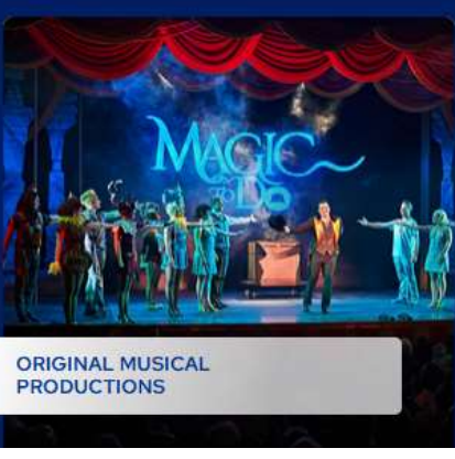
ORIGINAL MUSICAL PRODUCTIONS