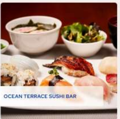
OCEAN TERRACE SUSHI BAR