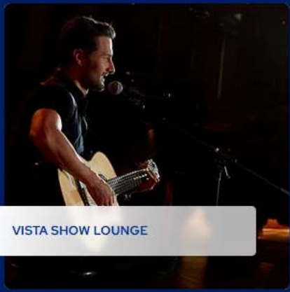
VISTA SHOW LOUNGE