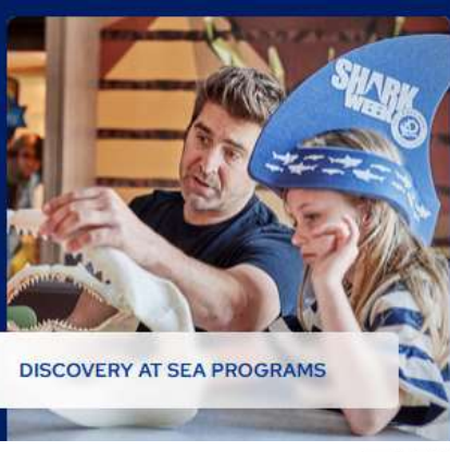
DISCOVERY AT SEA PROGRAMS