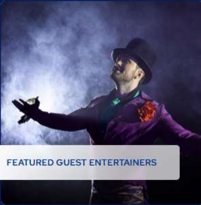
FEATURED GUEST ENTERTAINERS