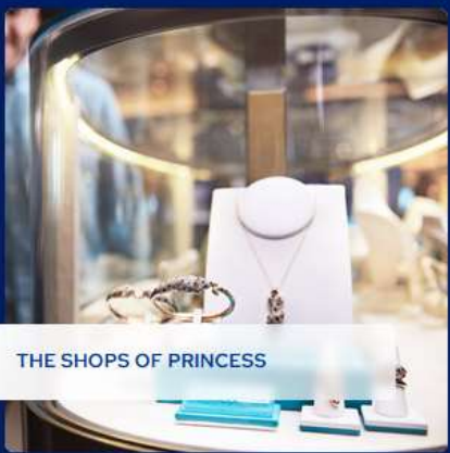
THE SHOPS OF PRINCESS