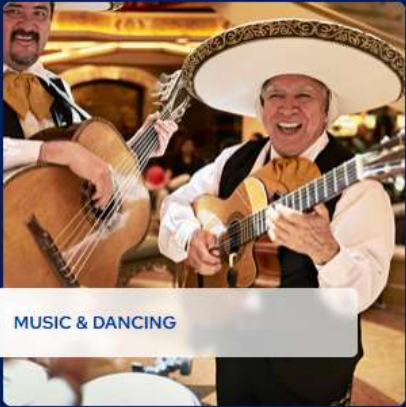
MUSIC & DANCING