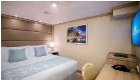
ห้องพักแบบมีหน้าต่าง (Premium Oceanview)