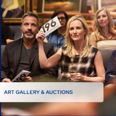
ART GALLERY & AUCTIONS