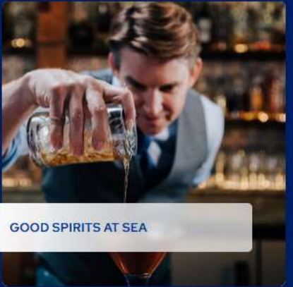
GOOD SPIRITS AT SEA