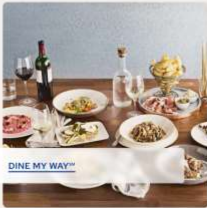
DINE MY WAY™