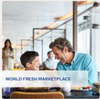
WORLD FRESH MARKETPLACE