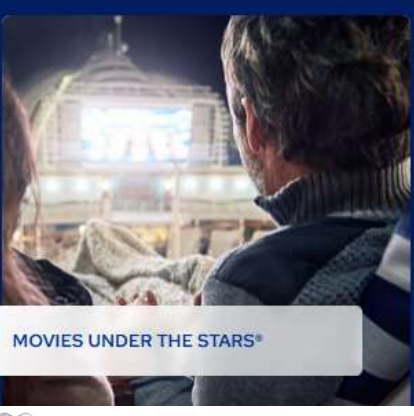
MOVIES UNDER THE STARS*