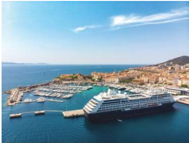
Ship plan Azamara Pursuit : Singapore - Kyoto, Osaka, Japan

Early Booking Bonus เมื่อจองภายใน 29 ส.ค. 2567 Save 20% + $300 Onboard Credit, Unlimited WiFi for one device, and a Premium Beverage Package for two when booking a Veranda or higher on select 2024-2025 sailings. ดูรายละเอียดเงื่อนไขโปรโมชั่น ท้ายรายการ