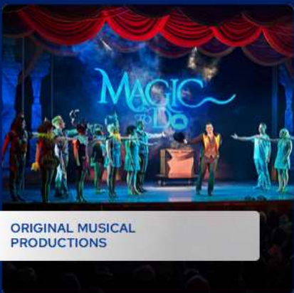
ORIGINAL MUSICAL PRODUCTIONS