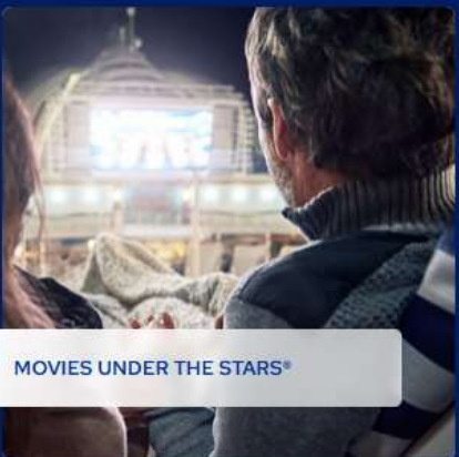
MOVIES UNDER THE STARS®