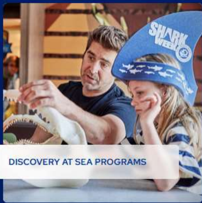
DISCOVERY AT SEA PROGRAMS