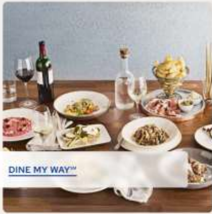
DINE MY WAY™