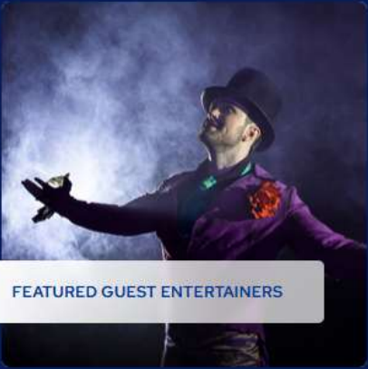
FEATURED GUEST ENTERTAINERS