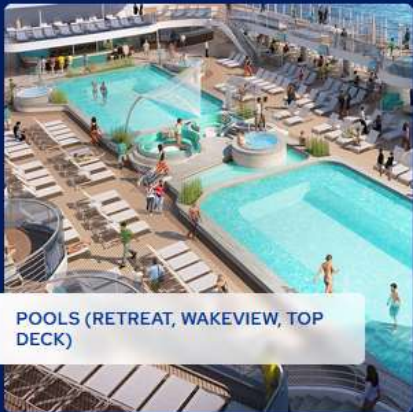
POOLS (RETREAT, WAKEVIEW, TOP DECK)