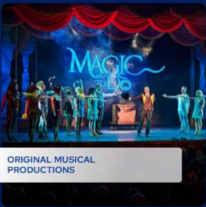
ORIGINAL MUSICAL PRODUCTIONS