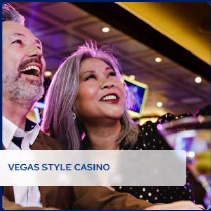
VEGAS STYLE CASINO