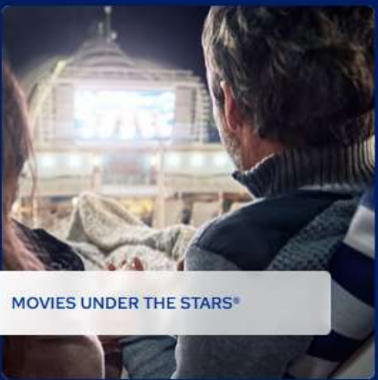
MOVIES UNDER THE STARS®