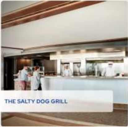
THE SALTY DOG GRILL