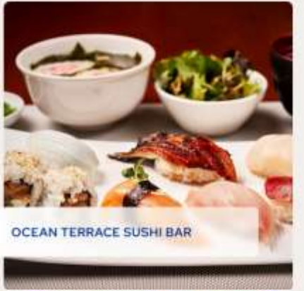
OCEAN TERRACE SUSHI BAR