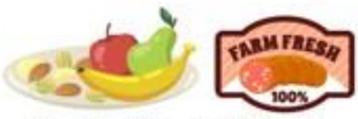
ผลิตภัณฑ์พืชผักที่เน่าเสีย และผลิตภัณฑ์จากสัตว์