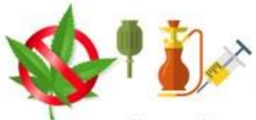
ยาเสพติดทุกชนิด