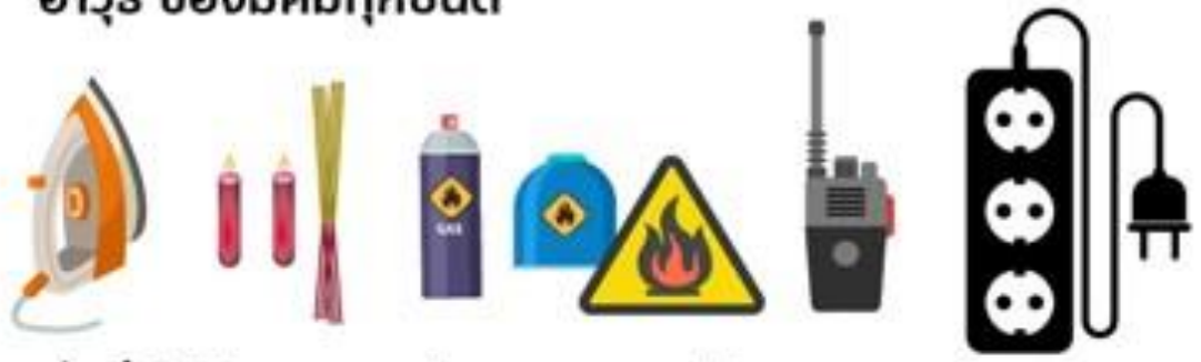
สิ่งที่ทำให้เกิดความร้อน และเปลวไฟทุกชนิด รวมถึงวิทยุเครื่องข่าย และปลั๊กไฟพ่วง