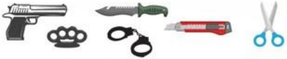
อาวุธ ของมีคมทุกชนิด