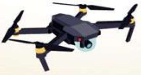
ห้ามใช้โดรนถ่ายภาพบนเรือ หากท่านจะนำโดรนไปถ่ายภาพบนฝั่ง จะต้องทำเรื่องขออนุญาตก่อนทุกครั้ง

หมายเหตุ : หากตรวจพบสิ่งของต้องห้าม หรือต้องสงสัยทุกชนิด ทางเรือจะเก็บกระเป๋าของท่านไว้ที่หน่วยรักษาความปลอดภัย และจะเก็บสิ่งของเหล่านั้นไว้ จนกว่าจะถึงวันขึ้นจากเรือ จึงจะคืนสิ่งของให้ท่าน