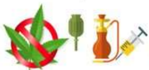
ยาเสพติดทุกชนิด