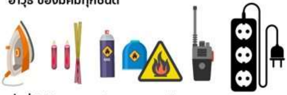
สิ่งที่ทำให้เกิดความร้อน และเปลวไฟทุกชนิด รวมถึงวิทยุเครื่องข่าย และปลั๊กไฟพ่วง