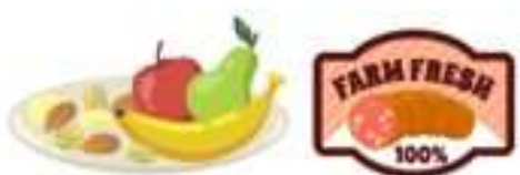
ผลิตภัณฑ์พืชผักที่เน่าเสีย และผลิตภัณฑ์จากสัตว์