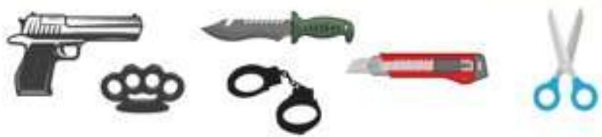
อาวุธ ของมีคมทุกชนิด