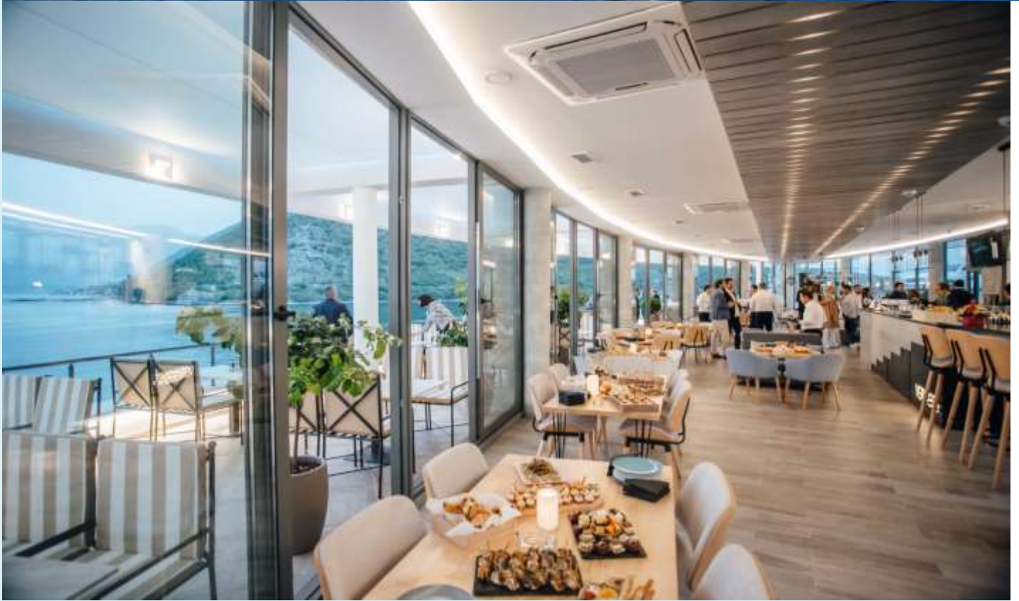
เที่ยว รับประทานอาหารกลางวัน ณ Verige 65 Restaurant & Bar