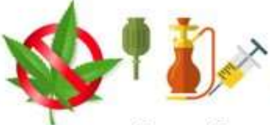
ยาเสพติดทุกชนิด