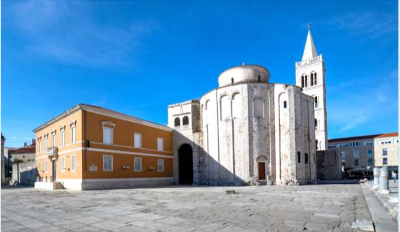
จากนั้นนำท่านชม มหาวิหารเซนต์อนาตาเซีย (St. Anastasia's Cathedral) เป็นโบสถ์คาทอลิกสร้างขึ้นในศตวรรษที่ 13 มหาวิหารเซนต์อนาตาเซียเป็นตัวอย่างสถาปัตยกรรมโกธิกที่มีหอคอยสูง 69 เมตร