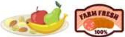
ผลิตภัณฑ์พืชผักที่เน่าเสีย และผลิตภัณฑ์จากสัตว์