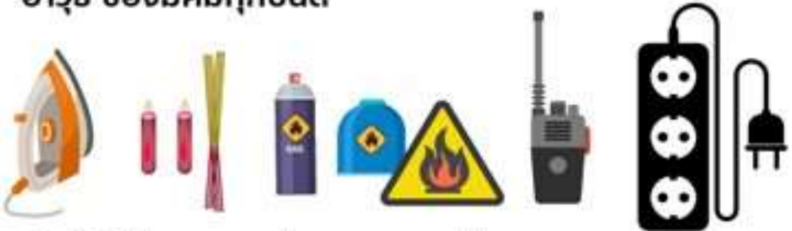
สิ่งที่ทำให้เกิดความร้อน และเปลวไฟทุกชนิด รวมถึงวิทยุเครื่องข่าย และปลั๊กไฟพ่วง