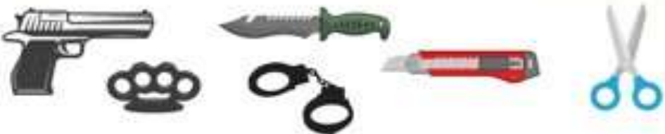
อาวุธ ของมีคมทุกชนิด