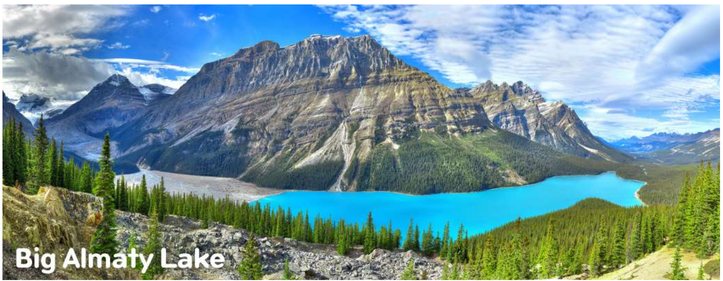
Big Almaty Lake

วันที่ห้า ทะเลสาบบีกอัลมาตี- Ethno Village- Mega Park (B/L/-)