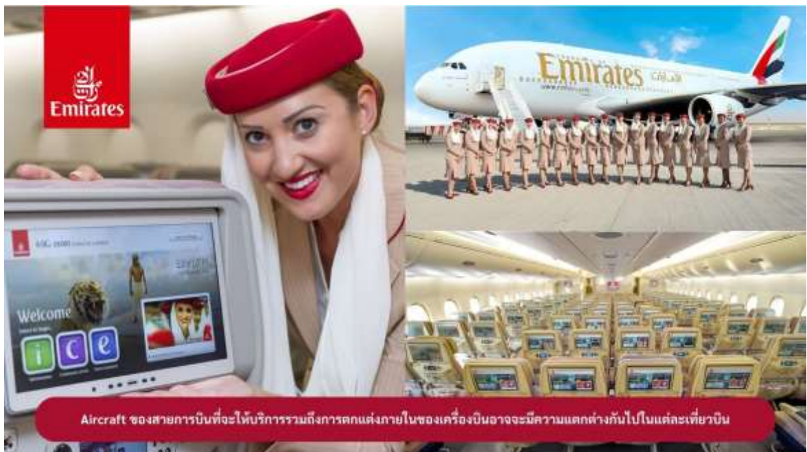
Aircraft ของสายการบินที่จะให้บริการรวมถึงการตกแต่งภายในของเครื่องบินอาจจะมีความแตกต่างกันไปในแต่ละเที่ยวบิน

23.00 น. !!!! ขณะเดินทางพร้อมกัน ณ สนามบินสุวรรณภูมิ อาคารผู้โดยสารขาออกระหว่างประเทศ ชั้น 4 ประตู 9 แถว T สายการบินเอมิเรตส์ แอร์ไลน์ (EK) เจ้าหน้าที่ให้การต้อนรับและอำนวยความสะดวก