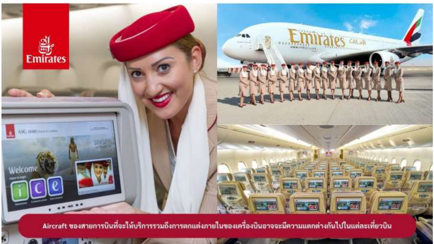
Aircraft ของสายการบินที่จะให้บริการรวมถึงการตกแต่งภายในของเครื่องบินอาจจะมีแตกต่างกันไปในแต่ละเที่ยวบิน

23.00 น. !!!! ขณะเดินทางพร้อมกัน ณ สนามบินสุวรรณภูมิ อาคารผู้โดยสารขาออกระหว่างประเทศ ชั้น 4 ประตู 9 แถว T สายการบินเอมิเรตส์ แอร์ไลน์ (EK) เจ้าหน้าที่ให้การต้อนรับและอำนวยความสะดวก